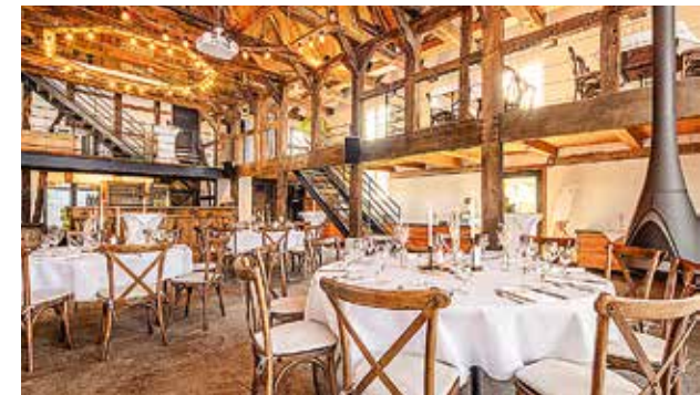
Voss am Chaussee, Unna, 40 bis 120 Personen