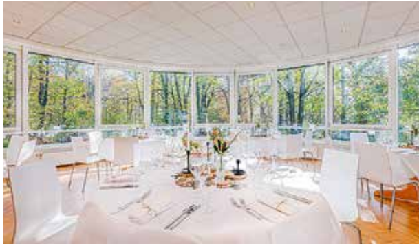
Clubhaus an den Bootshäusern, Dortmund, 40 bis 120 Personen