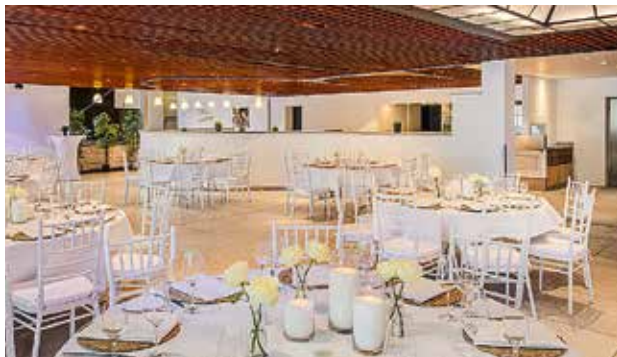
Eventforum Castrop-Rauxel, 40 bis 120 Personen