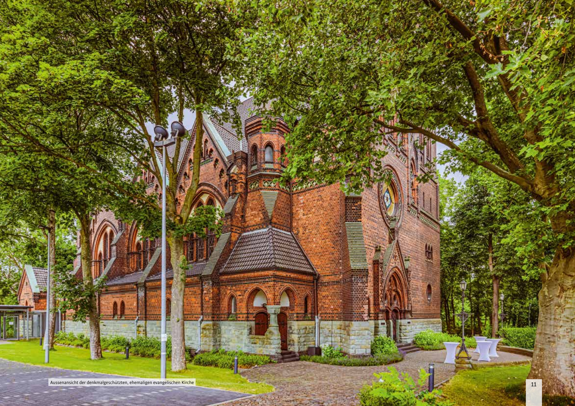
Aussenansicht der denkmalgeschützten, ehemaligen evangelischen Kirche