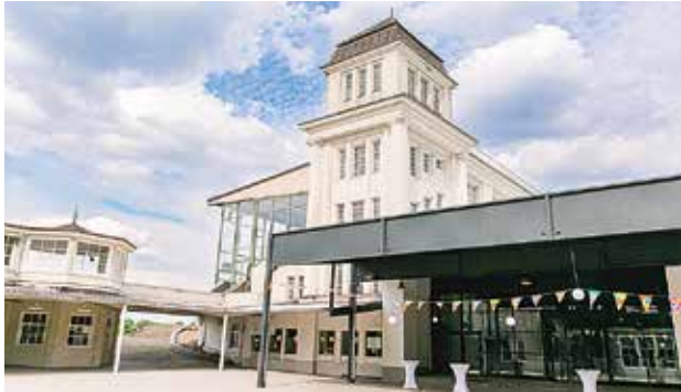
Wetthalle Dortmund, 100 bis 570 Personen

Weitere außergewöhnliche Veranstaltungsorte findet Ihr auf www.stolzenhoff.de