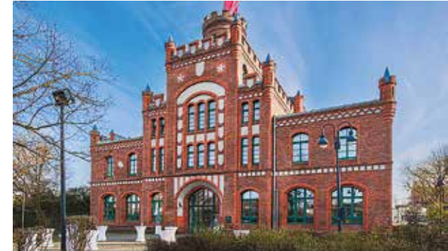
Alte Kaue, Dortmund, 100 bis 500 Personen