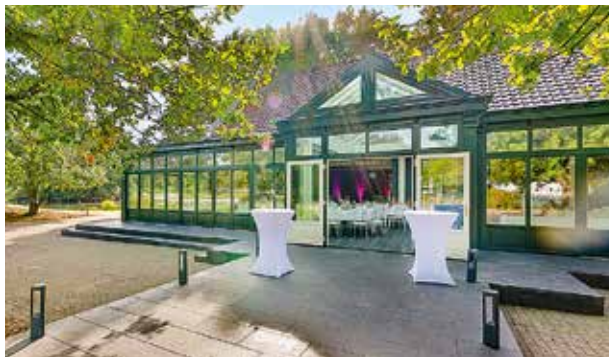
Festscheune am Ümminger See, Bochum, 60 bis 120 Personen